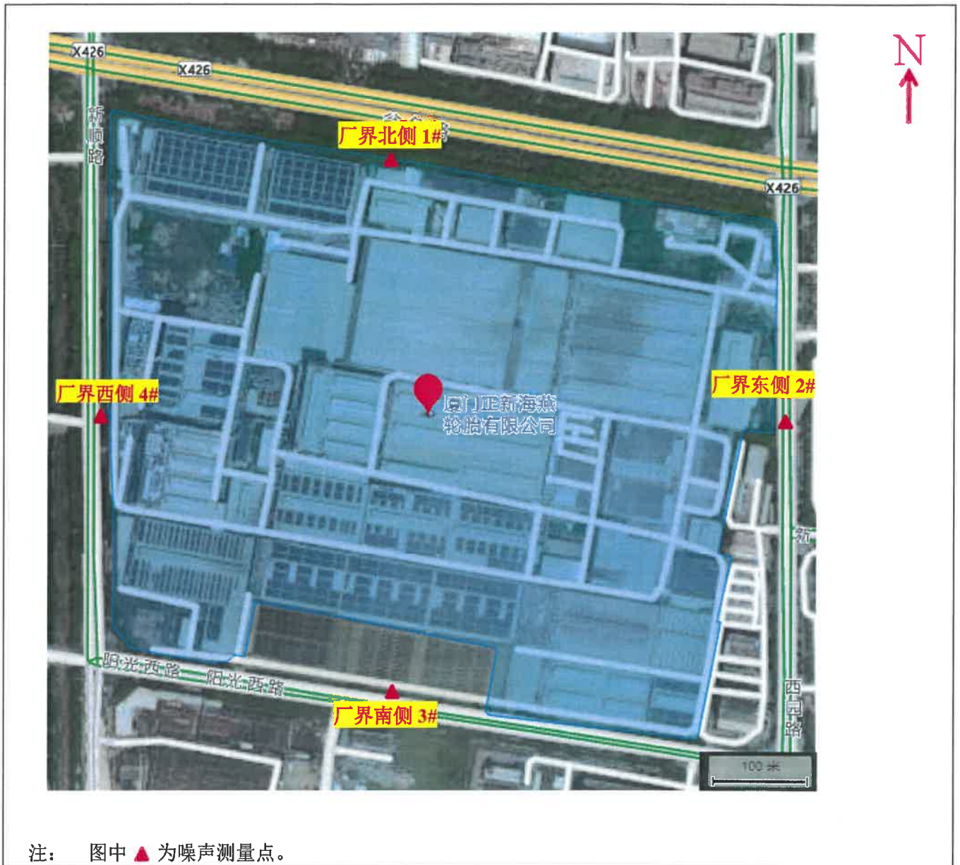
附录二：噪声采样信息